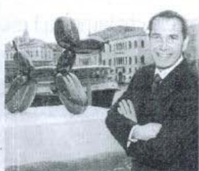
Il grande cuore all'ingresso di Palazzo Grassi. A destra, Jeff Koons con la sua scultura Balloon Dog e, sotto, l'arrivo di François Pinault