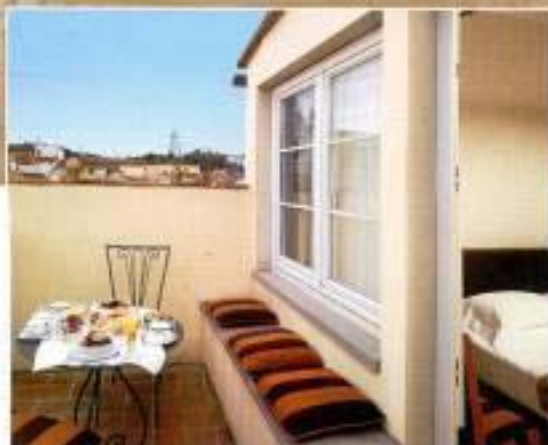
ФОТО СПРАВА > просторная терраса номера, имеющая площадь 43 квадратных метра и длинную кровать шириной 2 м

[ НАБОР ИЗДЕЛИЙ КОВАНЫЕ ]